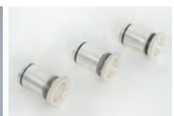
着脱式マウスピースレシーバー