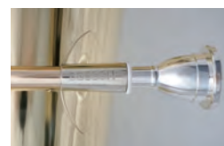
レシーバー使用時