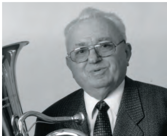
アントン・マイネル