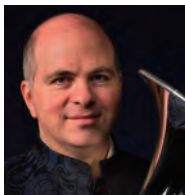
ファビアン・ヴァルラン Fabien Wallerand ジュネーヴ高等音楽院教授 パリ・オペラ座管弦楽団 ソロ奏者