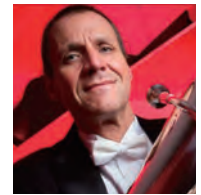
アラン・ベア Alan Baer マネス音楽大学講師 ジュリアード音楽院講師 ニューヨーク・フィルハーモニック 首席奏者