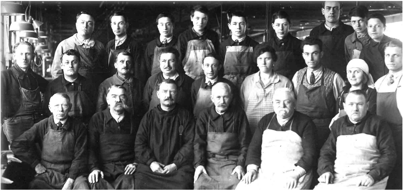
〈ビュッフェ・クランポン〉の楽器職人、マント・ラ・ヴィル 1930年