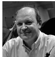
シモン・フックス Simon Fuchs チューリッヒ芸術大学教授 チューリッヒ・トーンハレ管弦楽団 ソロ奏者