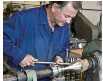
ミュートの製造には高い技術が必要とされる。熟練の職人の手によって正確にコントロールされて完成したデニス・ウィック社のミュートは、品質も音程も安定している。