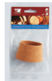
③ DWC07 ..... ¥1,980