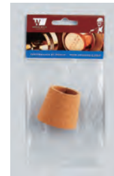
② DWC27 ..... ¥2,200