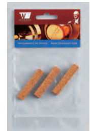
⑤ DWC33 ..... ¥1,980