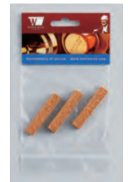
④ DWC05 ..... ¥1,650