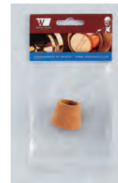
① DWC26 ..... ¥1,650