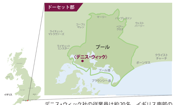
デニス・ウィック社の従業員は約20名。イギリス南部の工場で全製品を製造している。

デニス・ウィック社の製品は、たゆまぬ研究開発と改善努力により、世界中で愛され続けています。