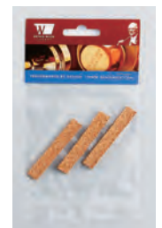
⑥ DWC24 ..... ¥1,540